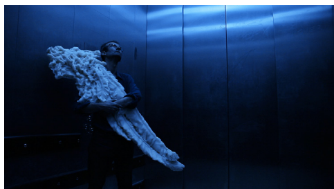
Le complexe de la salamandre