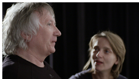
Au risque d'être soi